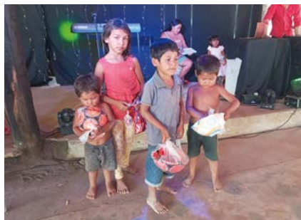
Kinder der Indiogruppe Rikbaktsa werden beschenkt.