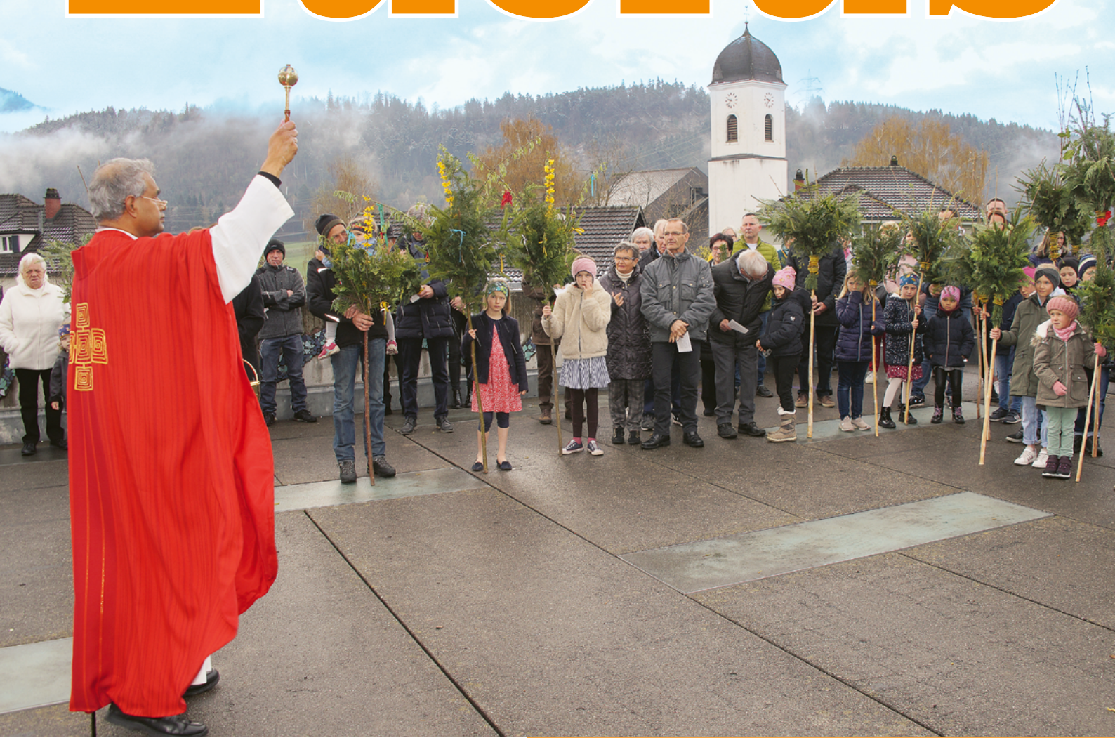
Palmsegnung am Schulplatz